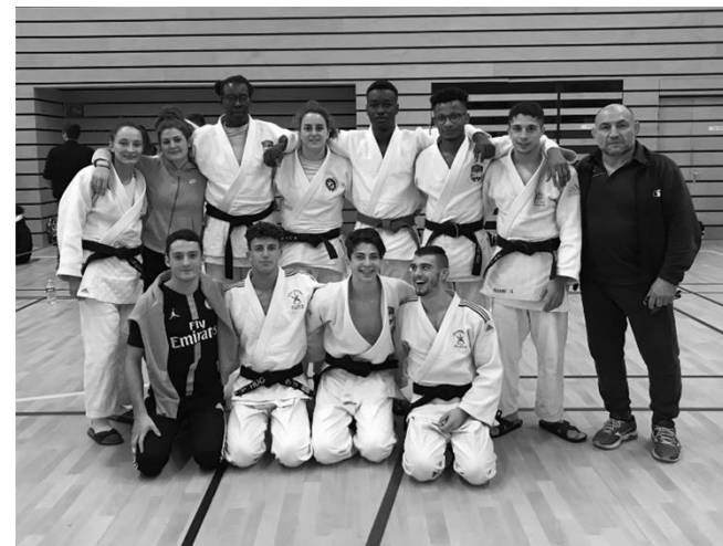
Pôle Universitaire BFC (Besançon + Dijon)